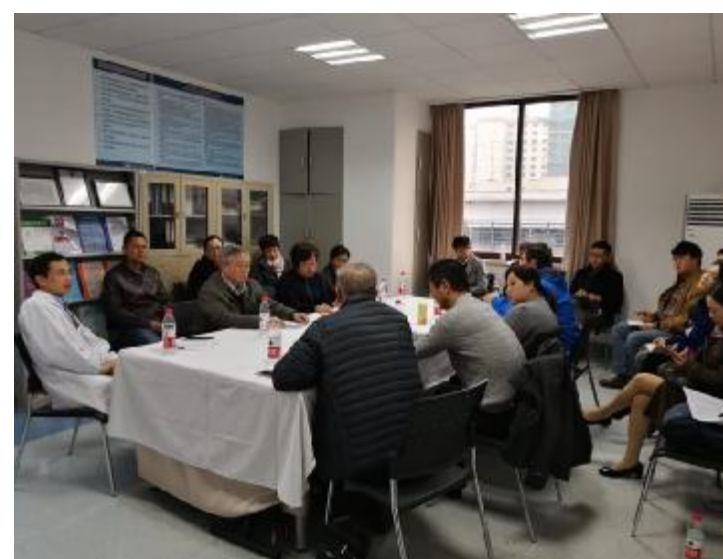
11月22日， 上海市核学会 临床核医学专业委员会 云克治疗专家会