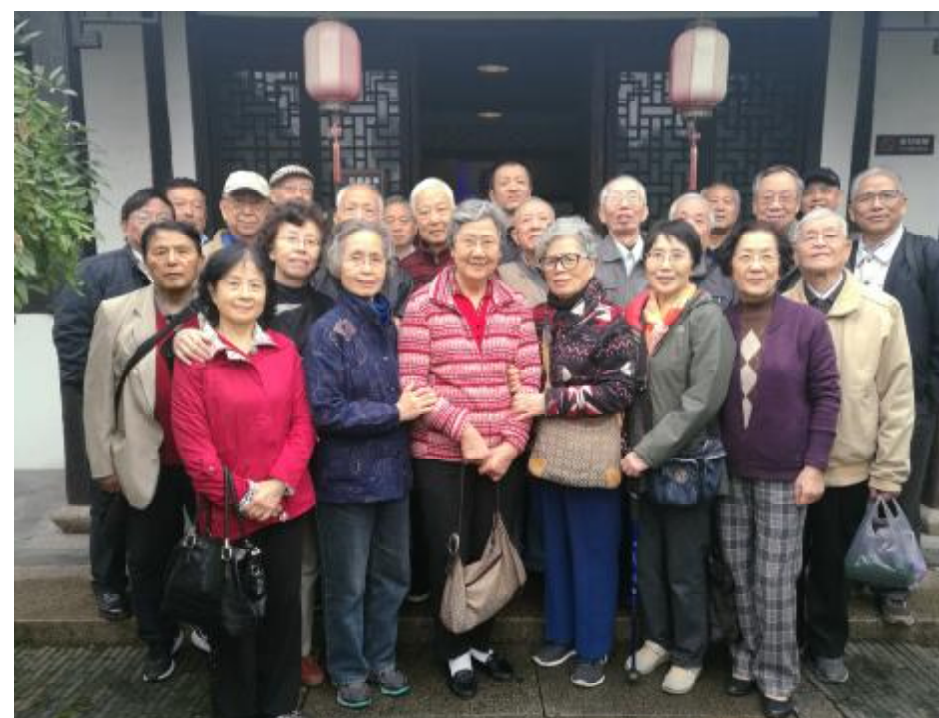
11月14日， 上海市核医学老年联谊会 新场镇秋游